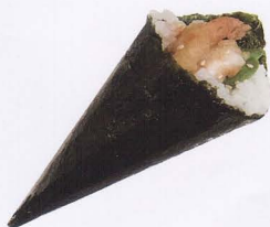
320. EBITEN TEMAKI* gambero* tempura € 4,00