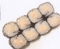
259. SAKE YAMAKI COTTO 8PZ* salmone € 4,00