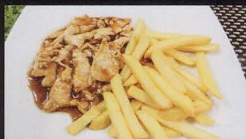
50A. POLLO* CON PATATINE FRITTE fried potatoes and chicken € 4,50