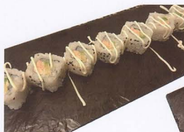
261. SAKE URAYAMAKI COTTO 8PZ* salmone, avocado, maionese € 6,50