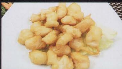
50. POLLO* FRITTO fried chicken € 4,50