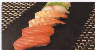
248. MISTO SUSHI 10PZ* salmone, tonno, polpo*, gambero* cotto solo 1 volta € 15,00