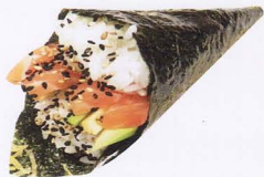
255. SAKE TEMAKI* salmone, avocado, maionese € 4,00