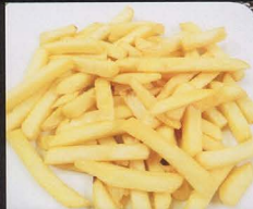
115. PATATINE FRITTE fresh fried potatoes € 3,00