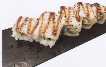
325. TEMPURA SAKE URAMAKI AVOCADO 8PZ* salmone fritto, avocado € 8,00