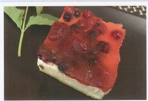
Torta con frutti di bosco € 4,00