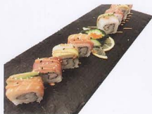
251. RAINBOW MAKI 8PZ* salmone, tonno, gambero cotto, avocado, branzino € 10,00