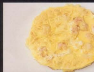
79. OMELETTE DI GAMBERO*