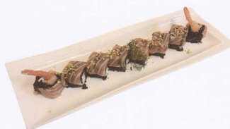
368. PHILADELPHIA BLACK URAMAKI CON SALMONE, GAMBERO FRITTO E GRANELLI DI MANDORLA O PISTACCHIO, RISO VENERE CON SALSA ESOTICA 8 PZ € 12,50