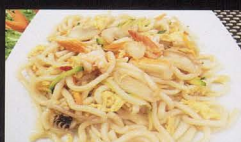
214. UDON CON FRUTTI DI MARE udon with seafood € 6,00