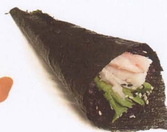
382. TEMAKI PHILADELPHIA BLACK CON RISO VENERE, GAMBERO COTTO, AVOCADO € 4,50