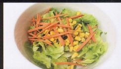
113. INSALATA MISTA mixed salad € 4,00