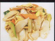
27. GNOCCHI DI RISO CON CARNE E VERDURA rice gnocchi meat vegetables € 4,50