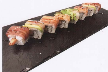
310. RAINBOW TEMPURA MAKI 8PZ* salmone, tonno, branzino, avocado, gambero fritto € 11,00