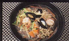
120. RAMEN IN BRODO CON FRUTTI DI MARE japanese noodles ramen with seafood € 6,00