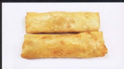
1. INVOLTINI PRIMAVERA 2PZ spring rolls € 2,00