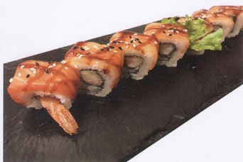
306. TEMPURA SAKE MAKI 8PZ* salmone, gambero fritto € 12,00