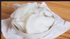
3. NUVOLETTE DI GAMBERO prawn crackers € 1,50