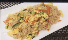
121. RAMEN SALTATI CON VERDURA japanese noodles ramen with vegetables € 5,00