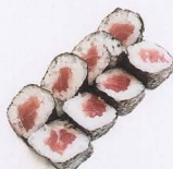
237. TEKKA MAKI 8PZ* tonno € 5,00