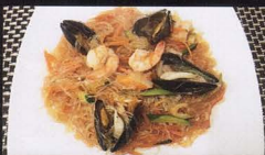
26. SPAGHETTI DI SOIA CON FRUTTI DI MARE* soya noodles with seafood € 5,00