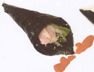
383. TEMAKI SPICY BLACK CON RISO VENERE, GAMBERO COTTO AVOCADO E PICCANTE € 4,50