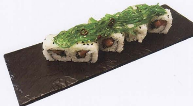
290. GREEN ROLL 8PZ* salsa kabayaki, alga, avocado, salmone € 8,50