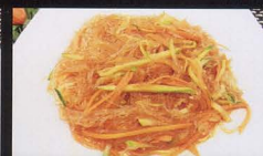
25. SPAGHETTI DI SOIA CON VERDURA PICCANTE soya noodles with vegetable spicy € 4,00