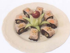
370. BLACK DOUBLE SAKE SALMONE COTTO E CRUDO AVOCADO CON SALSA PICCANTE E RISO VENERE 8PZ € 10,00