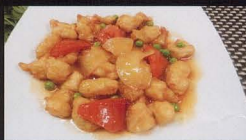
55. POLLO* IN SALSA AGRODOLCE sweet and sour chicken € 4,50