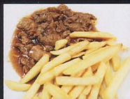
75. MANZO* CON PATATINE FRITTE