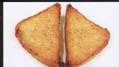
4. TOAST DI GAMBERO E SESAMO 2PZ shrimps toast € 3,50