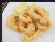
102. CALAMARI* FRITTI