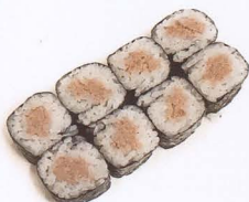
260. MAGURO YAMAKI COTTO 8PZ* tonno € 5,00