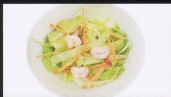
10. INSALATA CON GAMBERI IN SALSA CINESE salad with shrimp in chinese sauce € 4,50