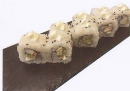
252. PHILADELPHIA MAKI COTTO 8PZ* philadelphia, avocado, gambero cotto € 6,50