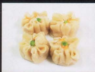
13. XIAO MAI DI GAMBERI AL VAPORE steamed shrimp dumplings € 3,00