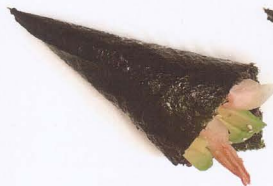
380. TEMAKI PHILADELPHIA BLACK CON VENERE, GAMBERO FRITTO, AVOCADO € 4,50