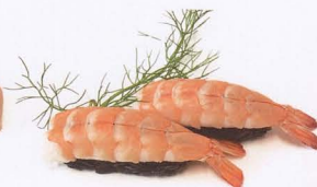
362. NIGIRI BLACK EBI RISO VENERE E GAMBERO COTTO 2PZ € 4,00