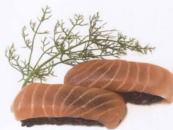
361. NIGHIRI BLACK SAKE RISO VENERE E SALMONE 2 PZ € 4,00