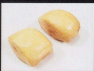
305. PANE CINESE FRITTO fried chinese bread € 2,50