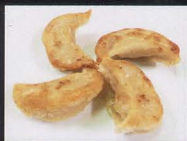
12. RAVIOLI DI CARNE ALLA GRIGLIA 4PZ grilled meat dumplings € 3,00