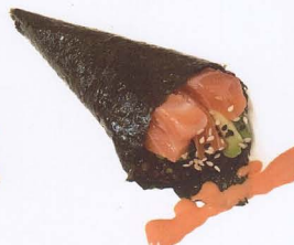
385. TEMAKI SPICY BLACK CON RISO VENERE, SALMONE, AVOCADO E SALSA PICCANTE € 4,50