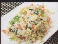
21. RISO CON VERDURA MISTA fried rice with vegetables € 4,00