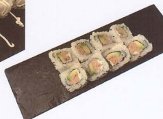
262. MAGURO URAYAMAKI COTTO 8PZ* tonno, avocado, maionese € 6,50