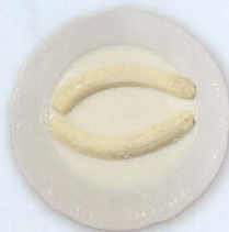
Banana alla tailandese con latte di cocco € 4,00