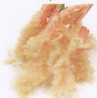
265. TEMPURA DI GAMBERI FRITTA solo 1 volta fried shrimp tempura € 9,00