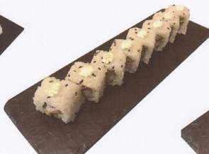
264. PHILADELPHIA MAGURO URAYAMAKI COTTO 8PZ* philadelphia, tonno, avocado € 6,50