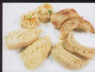
15. MISTO DI RAVIOLI CINESI assorted dumplings € 5,50