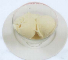
Gelato alla crema € 4,00