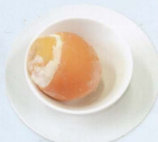
Gelato al mandarino € 4,00