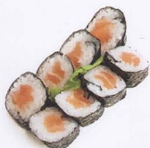
236. SAKE MAKI 8PZ* salmone € 4,50