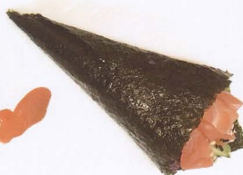
384. TEMAKI PHILADELPHIA BLACK CON RISO VENERE E SALMONE AVOCADO € 4,50