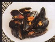
109. COZZE* ALLA MARINARA