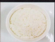
22. Riso bianco steamed rice € 1,50