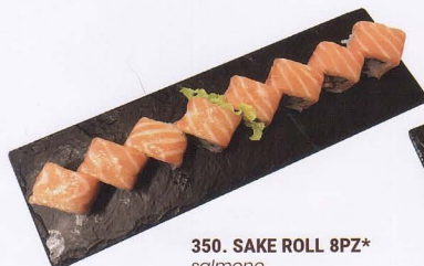
350. SAKE ROLL 8PZ* salmone € 6,50