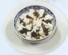
Coppa monocina con panna e cioccolato € 4,00