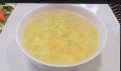
31. ZUPPA DI MAIS E POLLO chicken corn soup € 3,50