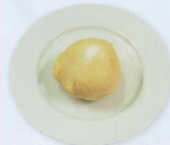
Gelato fritto € 4,00