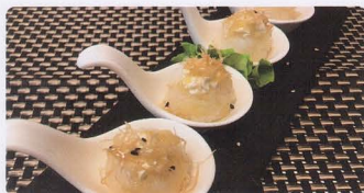
335. PHILADELPHIA NIDO 4PZ* philadelphia, riso, pasta katagi, salsa sakura € 5,00