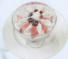
Gelato al yogurt con frutti di bosco € 4,00