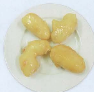
Frutta mista frita o caramellata € 4,00