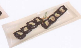
365. PHILADELPHIA BLACK URAMAKI COTTO CON TONNO COTTO, AVOCADO E RISO VENERE 8PZ € 9,00