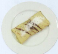
Nutella frita € 4,00