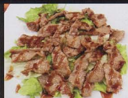
217. MANZO* ALLA GRIGLIA