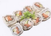
240. FUTOMAKI 8PZ* salmone, cetriolo, gambero cotto, surimi € 8,50