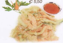
266. TEMPURA DI VERDURA MISTA solo 1 volta vegetables fried tempura € 5,50