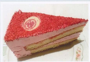
Torta del drago alle fragoline di bosco € 4,00