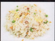
16. RISO ALLA CANTONESE cantonese style fried rice € 4,00