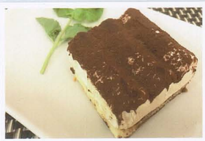
Tiramisu € 4,00