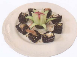
367. PHILADELPHIA BLACK URAMAKI CON GAMBERO FRITTO, RISO VENERE, GRANELLI DI PISTACCHI O MANDORLA CON SALSA ESOTICA 8 PZ € 12,50