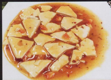
61. TOFU PICCANTE (formaggio di soia) bean curd spicy € 4,00