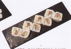
273. CALIFORNIA SAKE URAMAKI 8PZ* salmone, maionese, avocado € 7,50