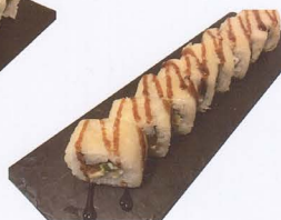
284. CALIFORNIA SAKE MAKI FRITTO 8PZ* maionese, salmone, avocado € 7,50