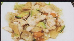
53. POLLO* CON VERDURA MISTA chicken with vegetables € 4,50