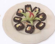
366. PHILADELPHIA BLACK URAMAKI CON SALMONE E RISO VENERE 8PZ € 10,00