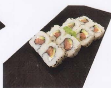
275. PHILADELPHIA SAKE URAMAKI 8PZ* philadelphia, salmone, avocado € 7,50