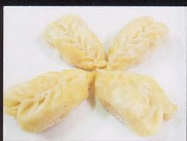
14. RAVIOLI DI VERDURA AL VAPORE steamed vegetables dumplings € 3,00