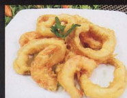
105. FRITTURA DI MARE*