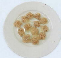
Noce caramellato € 4,00