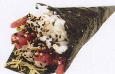
257A. SPICY MAGURO TEMAKI* tonno, salsa piccante, avocado € 4,50