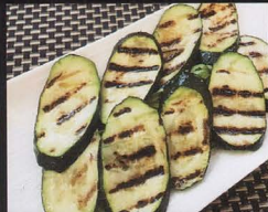
114. ZUCCHINE ALLA GRIGLIA grilled zucchini € 4,00