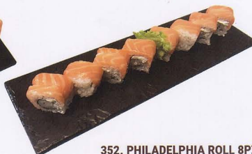
352. PHILADELPHIA ROLL 8PZ* philadelphia, salmone € 6,50