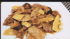
68. MANZO* CON FUNGHI E BAMBU beef with mushrooms bamboo € 5,00