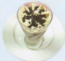
Coppa cioccolato € 4,00