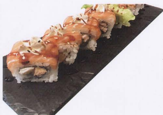
323. PHILADELPHIA SAKE MAKI 8PZ* philadelphia, salmone, avocado € 8,00