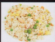
18. RISO CON GAMBERI fried rice with shrimp € 4,00