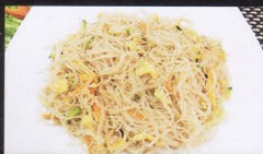
23. SPAGHETTI DI RISO CON CARNE E VERDURA rice noodles meat vegetables € 4,00