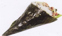
257. MAGURO TEMAKI* tonno, avocado, maionese € 4,50