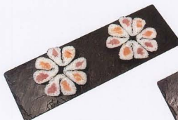
254. MAKI LOVE 8PZ* tonno, salmone € 8,00