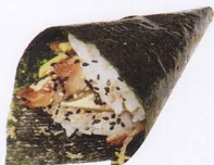
256A. SPICY EBI TEMAKI* gambero cotto, avocado, salsa piccante € 4,00