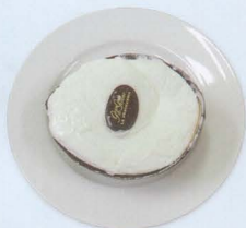
Gelato al cocco € 4,00