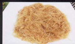
24. SPAGHETTI DI SOIA CON CARNE soya noodles with meat € 4,00