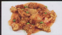
38. MAIALE* IN SALSA AGRODOLCE sweet and sour pork € 4,50