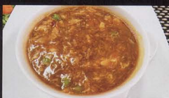
32. ZUPPA AGROPICCANTE hot and sour soup € 3,50