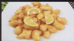
51. POLLO* FRITTO CON SALSA DI LIMONE fried chicken with lemon sauce € 4,50