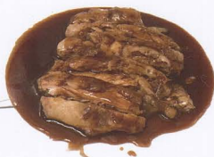
58. POLLO* CROCCANTE STUFATO ALLA CINESE solo 1 volta chicken chinese style € 5,00