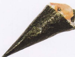
321. SPICY EBITEN TEMAKI* gambero* tempura, salsa piccante € 4,00