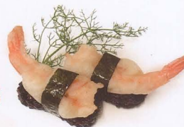
363. NIGIRI BLACK EBITEN RISO VENERE E GAMBERO FRITTO 2PZ € 4,00