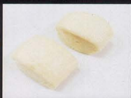
304. PANE CINESE AL VAPORE steamed chinese bread € 2,50