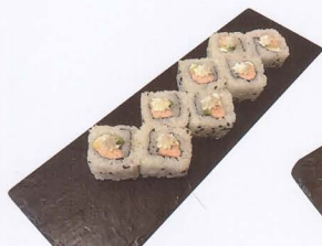
263. PHILADELPHIA SAKE URAYAMAKI COTTO 8PZ* philadelphia, salmone, avocado € 6,50