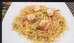
28. TAGLIOLINI CON GAMBERI E VERDURA fried noodles shrimp vegetables € 4,50