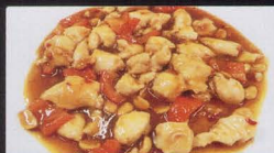
49. POLLO* KUN BAO PICCANTE spicy chicken € 4,50