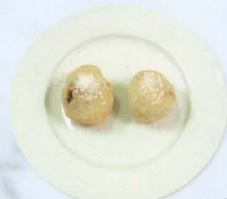
Cocco fritto € 4,00