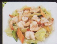
86. GAMBERI* CON VERDURA MISTA