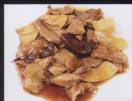
64. ANATRA* CON FUNGHI E BAMBU