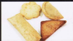
7. MISTI FRITTO CINESE chinese mixed starter € 4,50