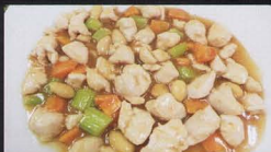
46. POLLO* CON MANDORLE chicken and almonds € 4,50