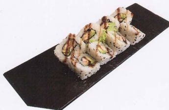
291. TEMPURA URAMAKI PESCE FRITTO 8PZ* avocado, pesce fritto € 8,00