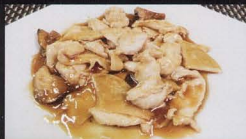
47. POLLO* CON FUNGHI E BAMBU chicken with mushrooms bamboo € 4,50