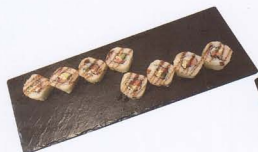
285. PHILADELPHIA SAKE MAKI FRITTO 8PZ* salmone, avocado, philadelphia € 7,50