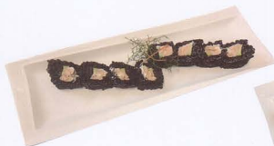
364. PHILADELPHIA BLACK URAMAKI COTTO CON SALMONE COTTO, AVOCADO E RISO VENERE 8PZ € 8,50