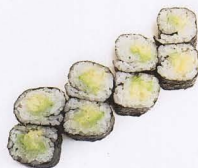
295. AVOCADO MAKI 8PZ avocado € 4,00