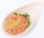
271. TARTARE DI SALMONE CON UOVA DI QUAGLIA 1 solo volta € 7,00