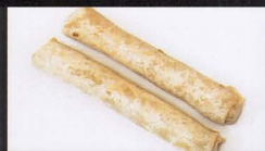
400. INVOLTINI GIAPPONESE CON GAMBERI E FORMAGGIO japanese shrimp and cheese rol € 3,50