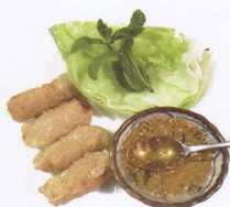
2. NEME INVOLTINI VIETNAMITI 4PZ solo 1 volta vietnam rolls € 3,50