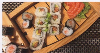
330. MISTO SUSHI PARTY 19PZ solo 1 volta € 20,00