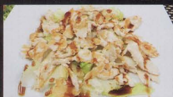
216. POLLO* ALLA GRIGLIA chicken grilled € 7,00