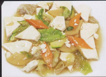
59. TOFU CON VERDURA (formaggio di soia) bean curd with vegetables € 4,00