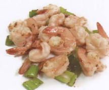
92. GAMBERI* CON SALE E PEPE solo 1 volta salt and pepper shrimp € 5,50