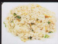
17. RISO ALLA THAIANDESE PICCANTE CON GAMBERI E POLLO thai style fried rice € 4,50