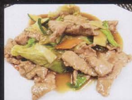
74. MANZO* CON VERDURA