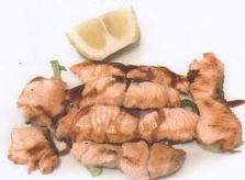
220. SALMONE GRIGLIATI CON SALSA TERIYAKI* solo 1 volta € 9,00