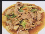
63. ANATRA* CON VERDURA