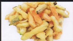
5. FRITTO MISTO VERDURA fried vegetables € 3,50