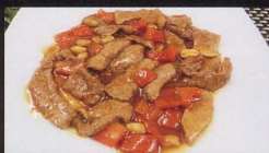
69. MANZO* ALLA KUNG BAO PICCANTE spicy beef € 5,00