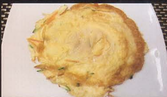
81. OMELETTE DI VERDURA