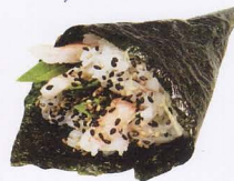
256. CALIFORNIA TEMAKI* maionese, avocado, gambero* cotto € 4,00