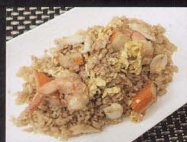
16A. RISO CHAO LOU FAN fried rice chinese style € 5,00