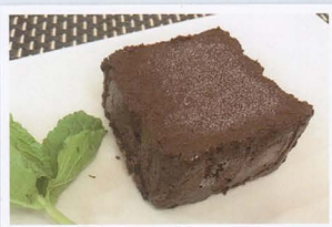
Torta alla cioccolata € 4,00