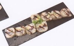
287. PHILADELPHIA MAGURO MAKI FRITTO 8PZ* philadelphia, tonno, avocado € 7,50