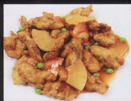
66. ANATRA* CON SALSA AGRODOLCE