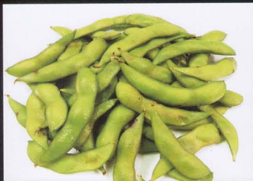
6. EDAMAME (fagioli di soia) japanese soy beans € 4,00