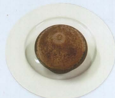
Tartufo nero € 4,00