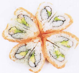
282. VALENTINO MAKI 8PZ* salmone, gambero* cotto, avocado € 8,50