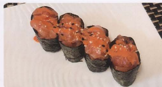
270. SPICY SALMONE PICCANTE 4PZ* salmone, salsa piccante € 7,00