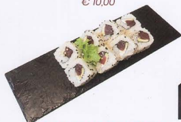
274. CALIFORNIA MAGURO URAMAKI 8PZ* maionese, tonno, avocado € 8,00