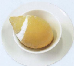
Gelato al limone € 4,00