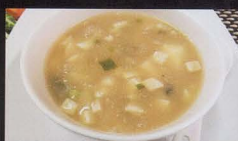
210. ZUPPA DI MISO E TOFU tofu and miso soup € 3,50