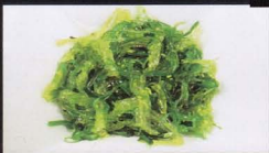
269. INSALATA DI ALGA seaweed salad € 4,50