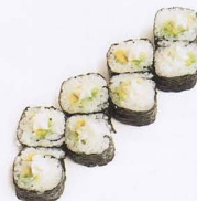
297. PHILADELPHIA MAKI 8PZ philadelphia € 4,00