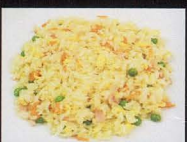
20. RISO AL CURRY fried rice with curry € 4,00