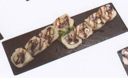
286. CALIFORNIA MAGURO MAKI FRITTO 8PZ* maionese, avocado, tonno € 7,50