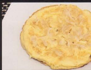
80. OMELETTE CON POLLO* E FORMAGGIO