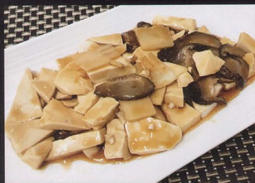
60. TOFU CON FUNGHI E BAMBU (formaggio di soia) bean curd with mushrooms bamboo € 4,00