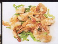
219. GAMBERI GRIGLIATI