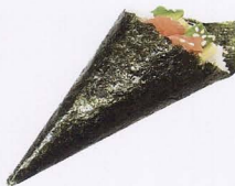
255A. SPICY SAKE TEMAKI* salmone, avocado, salsa piccante € 4,00