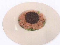
369. INSALATA DI TARTARE DI SALMONE CON RISO VENERE E SALSA ESOTICA JAPANESE SALADE WITH SALMON AND VENUS RICE € 5,50