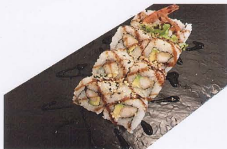
258. EBITEN MAKI 8PZ* gambero fritto, maionese, avocado € 8,00