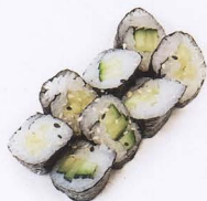
238. KAPPA MAKI 8PZ cetriolo € 3,50