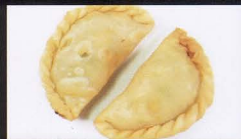
8. FOCACCIA CINESE DI CARNE 2PZ chinese focaccia € 3,50