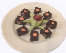
371. BLACK SPICY SAKE SALMONE, AVOCADO CON SALSA PICCANTE RISO VENERE 8 PZ € 10,00