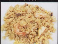
213. RISO CON FRUTTI DI MARE japanese style fried rice seafood € 5,00