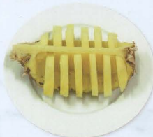
Ananas fresco € 4,00