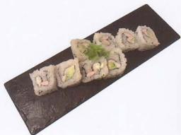
250. CALIFORNIA MAKI COTTO 8PZ* gamberi cotto, avocado, maionese € 6,50