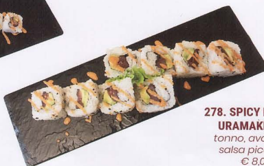
278. SPICY MAGURO URAMAKI 8PZ* tonno, avocado, salsa piccante € 8,00