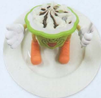
Coppa pagliaccio € 4,00