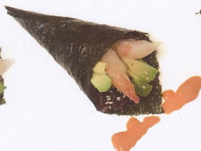
381. TEMAKI SPICY BLACK EBITEN CON RISO VENERE, GAMBERO FRITTO, AVOCADO E SALSA PICCANTE € 4,50