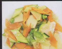
110. VERDURA MISTA SALTATA mixed vegetables € 4,00