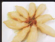
85. GAMBERI* FRITTI