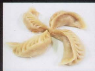
11. RAVIOLI DI CARNE AL VAPORE 4PZ steamed meat dumplings € 3,00