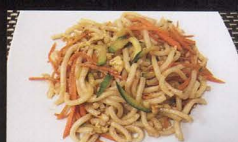
215. UDON SALTATI CON VERDURA udon with vegetable € 5,00